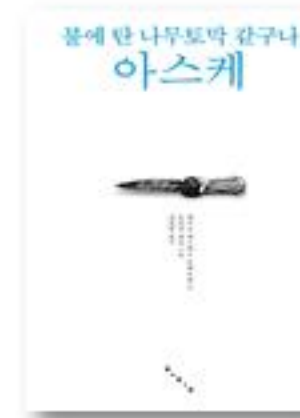
불에 탄 나무토막 같구나 아스케

우리가 고른 이 책들이 청소년 여러분들에게 '어떤 형태이든 자신들의 이야기를 만들며 살아가는 일상이 진로와 꿈을 찾아가는 현장'이라고 격려하며, '천천히 조금씩 단단한 내면을 갖도록 돕는' 그런 친구 같은 책이 되었으면 좋겠습니다.