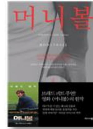
머니볼 · 마이클 루이스 지음 · 김찬별 노은아 옮김 · 2011년 | 비즈니스맵

힙합 본토인 미국 뮤지션에 대해 더 알고 싶으면 『더 랩-힙합의 시대』(시어 세라노 지음, 김봉현 옮김, 월북, 2016)를 보면 좋아. 내용, 그림, 디자인이 아주 멋진 책이야. 우리나라 힙합 뮤지션에 대해서는 『힙합하다』(송명선 지음, 안나푸르나, 2016)가 좋아. 빈지노에서 지코까지 42명이 자기 어린 시절부터 음악 얘기까지 들려주는 책이야. 그리고 한국 힙합의 특징과 멋진 한국 랩 가사를 소개한 책으로 『랩으로 인문학 하기』(박하재홍 지음, 슬로비, 2017)가 좋았어. 랩 가사를 쓰고 싶은 사람은 꼭 한 번 읽을 만해.