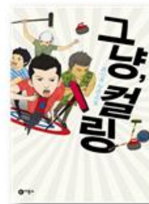
그냥, 컬링 · 최상의 지음 · 2011년 | 비룡소

“너, 대체 뭐가 되려고 그러니?” 아마도 평범한 어른이 위고를 만난다면 이런 질문을 던질 겁니다. 사랑의 감정을 알기도 전에 여자친구와 섹스에 빠져 아이를 임신케하고, 당장 쓰지도 않는 물건을 세일을 한다고 마구 사들이는 사람들에게 대항해 벌이는 ‘광고청소운동’은 정도를 넘습니다. 청춘은 그런 시기입니다. ‘대체 뭐가 되려고 그러니?’라는 질문에 답할 수 있는 성숙한 생각과 의식 있는 행동은 스무 살이 되면 마법처럼 생기는 걸까요? 우리시대에 수많은 위고들이 미치지 못하는 것과 넘치는 것, 두려움과 흥동 사이에서 흥들흥들 균형을 맞추며 천천히 배워가고 있음을 담담히 보여줍니다.