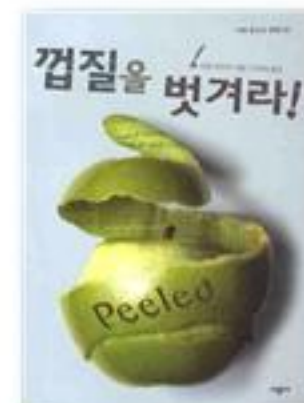
껍질을 벗겨라! · 조연 바꾸어 지음 · 이주희 옮김 · 2009년 | 시공사

청춘의 시절을 보내고 있는 우리 친구들은 어디서 삶의 재미를 느끼나요? 우리 삶에서 ‘그냥 좋아서’ 하고 싶은 것이 있다면 이 얼마나 행복할까요? “아무도 관심을 갖지 않고, 전혀 중요치 않은 일이다. 그래도 우리는 하고 있다, 컬링. 이 어둠 속, 혼자가 아니라서 좋다. 달려간다. 함께하기 위해서. 아마도 그래서 하는 것이다. 컬링, 우리는 하고 있다.” (279p)