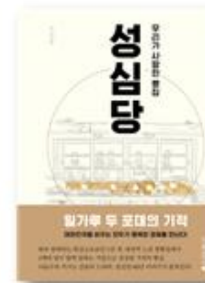
우리가 사랑한 빵집 성심당 · 김태호 글 · 2016년 | 남해의봄날

밀가루 두 포대로 시작한 빵집이 대전을 넘어 한국 최고의 빵집이 되기까지의 이야기다. 빵집으로 성공하는 방법이 아닌 무엇을 추구하며 살아야 하는지를 생각케 한다.