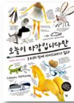
오늘이 마감입니다만 · 크리스토프 니먼 지음 · 신현림 옮김 · 2017년 | 월북