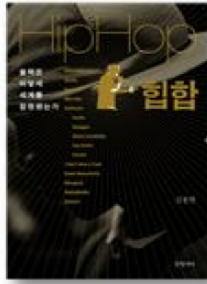
힙합 · 김봉현 지음 · 2014년 | 글항아리