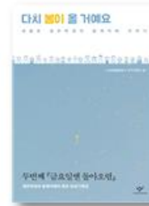
다시 봄이 올 거예요 · 416세월호참사작가기록단 씀 · 2016년 | 창비

나도 그랬는데, 너희가 킬킬대고 웃으며 보면 좋겠어. 실제로 당한 일이 있으면 이 참에 친구들과 신나게 욕하고 억눌렀던 마음도 풀고. 정말로 심한 일을 당해서 방법이 필요한 사람, 제대로 알고 싶은 사람은 『(10대와 통하는) 일하는 청소년의 권리 이야기』(이수정 지음, 철수와영희 2015)를 찾아봐. 제대로 아는 사람이 너희 편에서 쓴 아주 좋은 책이야.