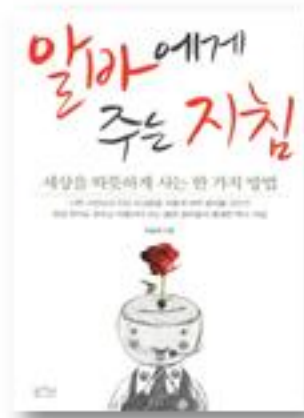
알바에게 주는 지침 · 이남석 지음 · 2012년 | 평사리