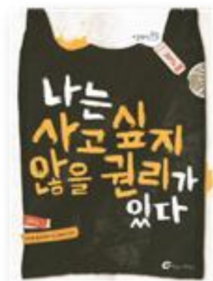
나는 사고 싶지 않을 권리가 있다 · 미카엘 올리비에 지음 · 윤예니 옮김 · 2012년 | 바람의아이들

“‘시험’, ‘입시’에 맞춰 살다보니 어느 순간 하고 싶은 게 ‘그냥’ 없어졌어요. 특별히 재미있는 일, 잘하는 일, 하고 싶은 일도 없는데 자꾸 ‘넌, 꿈이 뭐냐고?’ 물으면 불안해져요.” 도서관에서 일하다보면 무기력한 청소년들을 종종 만납니다. 꿈을 찾는 일은 ‘내가 나로서 존재해야 하는 이유’를 찾는 일입니다. 바르톨로메가 화가가 되고 싶었던 것도 아마 ‘내 자신’을 찾고 싶었기 때문일 겁니다. 그렇다고 ‘넌 꿈이 뭐냐?’는 질문에 성급히 답을 찾아야 할 필요는 없습니다. 사는 동안 두고두고 고민할 일입니다. 개인의 노력과 행복이 비례하지 않는 사회 분위기가 이 ‘불안’에 한 몫하고 있는 것 같습니다. 때문에 ‘지금 그렇게 낭만적으로 꿈만 꿀 때냐?’고 주변에서 채근하기도 하겠지요. 이 모든 것에도 불구하고 무언가 해보고 싶다는 순수한 열정만은 내려놓지 않았으면 좋겠습니다. 이것이 아마 당장은 아니더라도 ‘내가 나로 존재해야 하는 이유’에 대한 작은 실마리가 되어 줄 거라고 기대합니다.