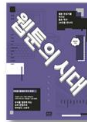
웹툰의 시대 · 위근우 지음 · 2015년 | 알에치코리아

진짜 자기 마음을 알게 되거든. 좋은 선택을 하려면 자기를 알아야 하고, 예술은 바로 그런 기회를 넓혀준대. 그래서 이 책을 추천할게.